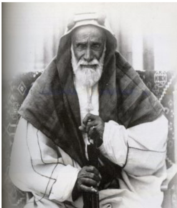
عيسى بن علي آل خليفة حكم خلال (1869-1932)