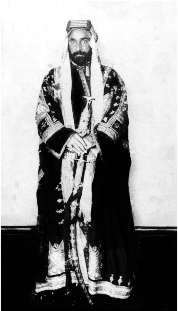
عبد الله بن عيسى بن علي ال خليفة (1883-1966)

سلّطت العريضة الضوء بشكل أكبر على علي الشيخ عبد الله ابن الحاكم "قبل أن يتسلّم الشيخ عبد الله زمام الحكم كان الظلم سائدًا ولكن عند تسلّمه السلطة رسميًا بات