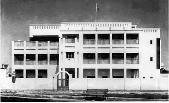
الوكالة السياسية البريطانية حوالي عام 1900

كانت تلك شرارة ما سيُطلق عليه "انتفاضة البحارنة". ستطير البرقيّات من مبنى المعتمدية السياسية (حيث سيتظاهر البحارنة وسيعتصمون طلبا للحماية البريطانية) إلى المقيمة السياسية في بوشهر، ومنها إلى حكومة الهند البريطانية، وصولا إلى حكومة لندن. وسيكون المعتمد السياسي في انتظار برقيّات الرد على وجل.